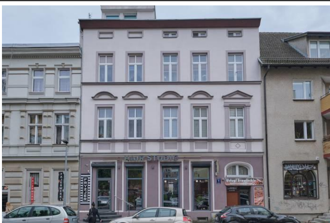
Widok frontowy kamienicy od strony zachodniej