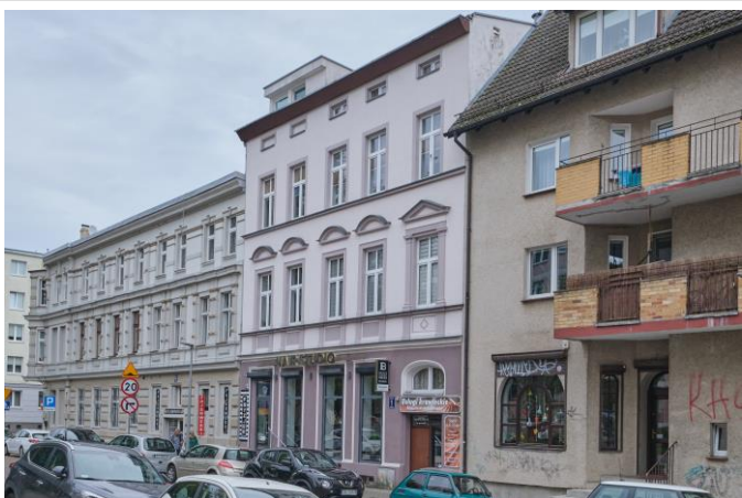
Widok ogólny bryły od strony południowo-zachodniej

7. Fotografia z opisem wskazującym orientację albo mapa z zaznaczonym stanowiskiem archeologicznym