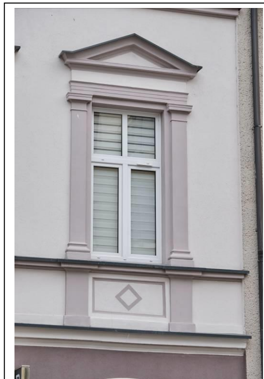
Fasada, okno skrajne pierwszego piętra