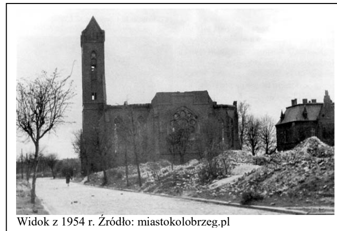
Widok z 1954 r.

historycznej bryły, kompozycji i podziałów elewacji frontowej wraz z detalami wystroju architektonicznego, oryginalnych stolarek (okiennych, drzwiowych, balustrad schodów); w przypadku zniszczenia historycznej formy, przy wymianie wskazane jest odtworzenie pierwotnego kształtu i podziałów.