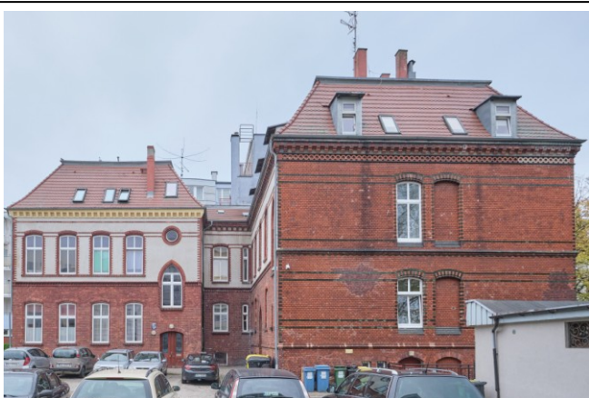
Widok ogólny zespołu od strony wschodniej

7. Fotografia z opisem wskazującym orientację albo mapa z zaznaczonym stanowiskiem archeologicznym