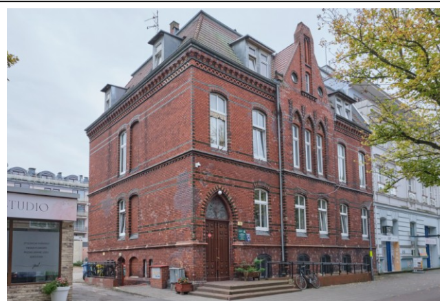
Widok dawnego budynku parafii od północnego- wschodu