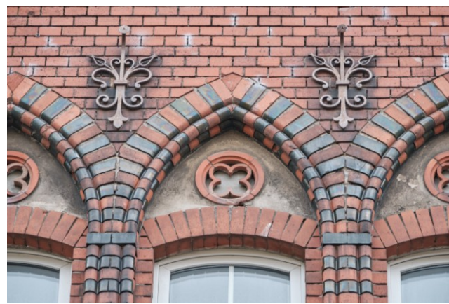
Detale wystroju elewacji frontowej dawnego budynku parafii