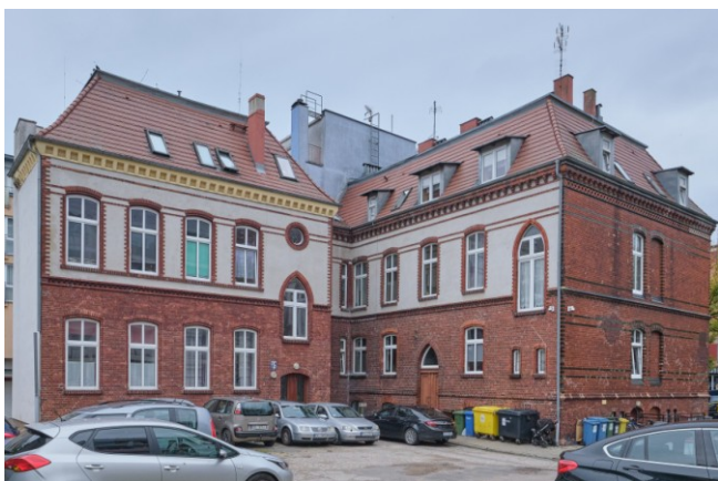
Widok ogólny zespołu od strony południowej