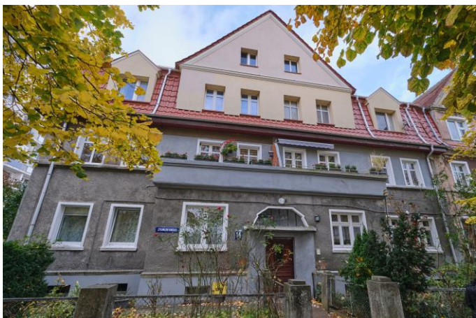
Widok elewacji frontowej

7. Fotografia z opisem wskazującym orientację albo mapa z zaznaczonym stanowiskiem archeologicznym