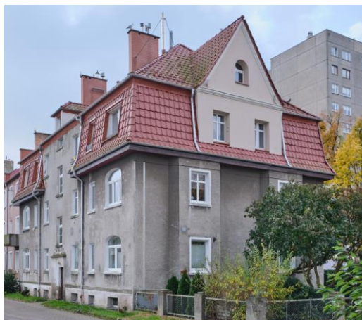
Widok na elewację boczną i tylną