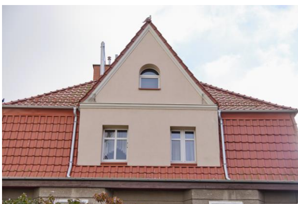
Widok na fasadę w elewacji bocznej