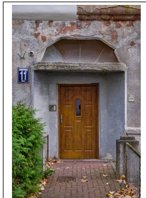
Wejście frontowe do kamienicy