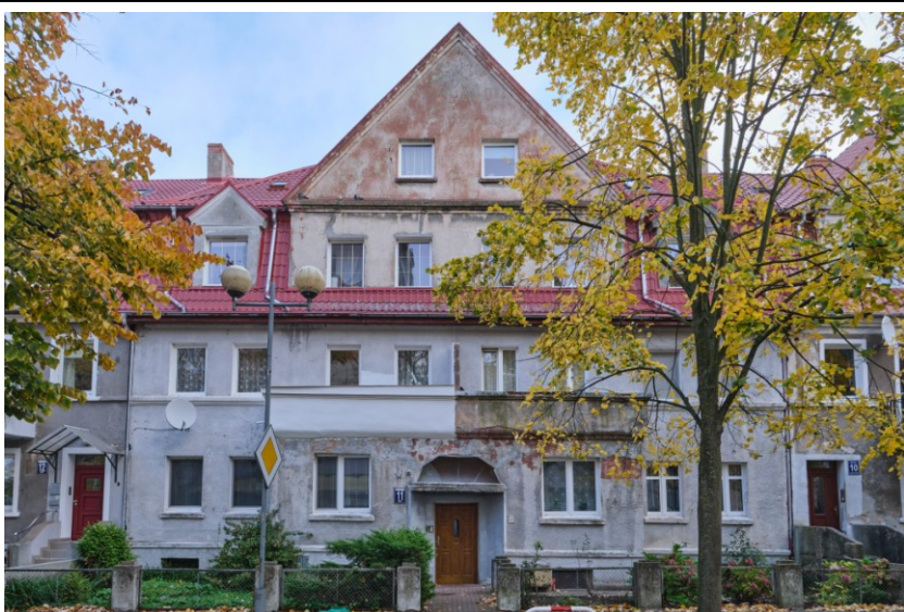
Widok elewacji frontowej

7. Fotografia z opisem wskazującym orientację albo mapa z zaznaczonym stanowiskiem archeologicznym