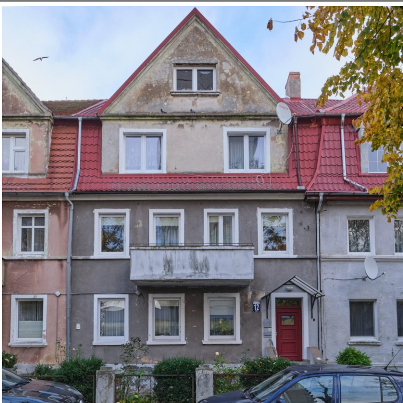
Widok na elewację frontową

7. Fotografia z opisem wskazującym orientację albo mapa z zaznaczonym stanowiskiem archeologicznym