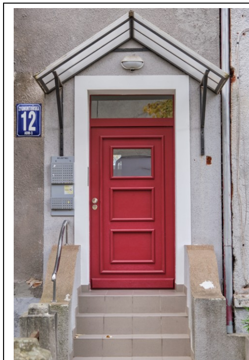
Wejście frontowe do kamienicy