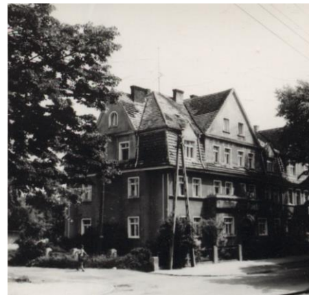
Kamienica nr 14 - widok z 1987 r.