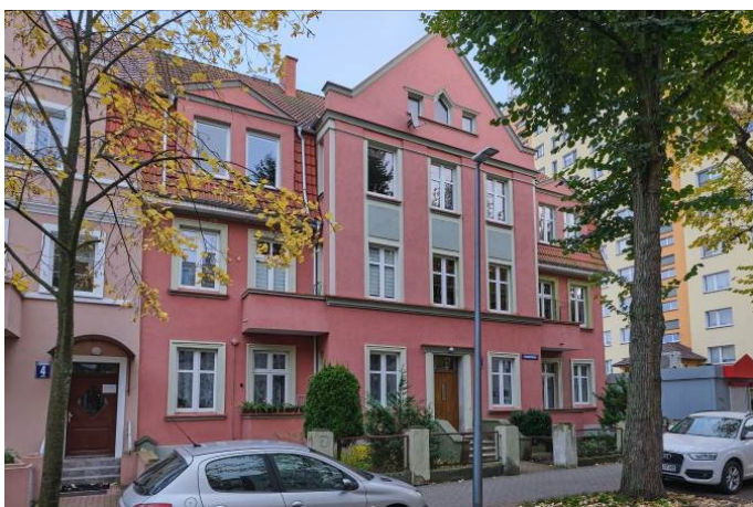
Widok na elewację frontową

7. Fotografia z opisem wskazującym orientację albo mapa z zaznaczonym stanowiskiem archeologicznym