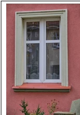
Widok detalu – okno ryzalitu