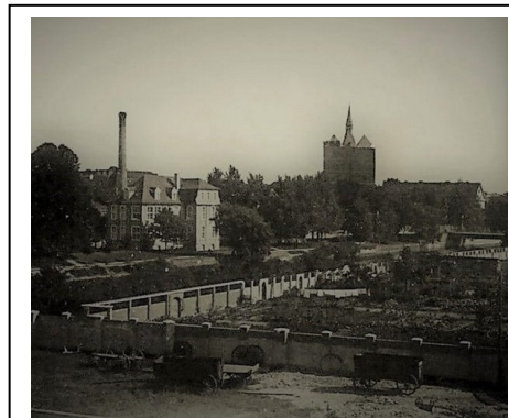
Ogrody kamienicy przy ul. Zygmuntowskiej