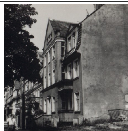
Kamienica nr 3 – stan z 1987 r.