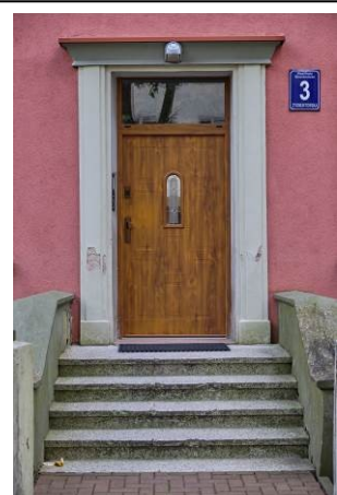
Widok detalu – drzwi frontowe