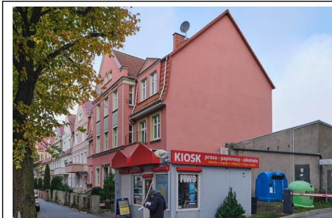
Widok ogólny bryły od pld.-zach.