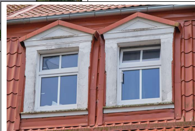
Okna kondygnacji poddasza