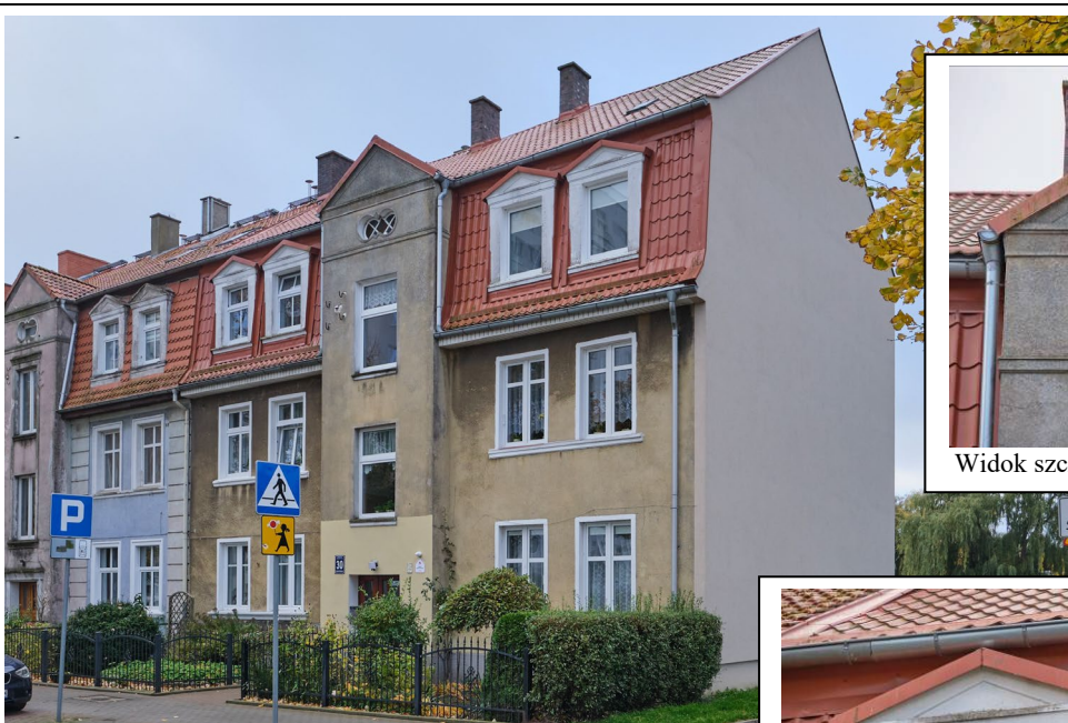
Widok ogólny bryły od strony pñ.-zach.

7. Fotografia z opisem wskazującym orientację albo mapa z zaznaczonym stanowiskiem archeologicznym