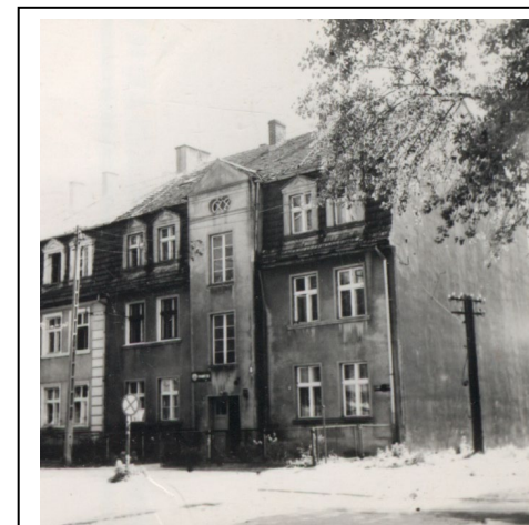
Kamienica nr 30 - widok z 1987 r.