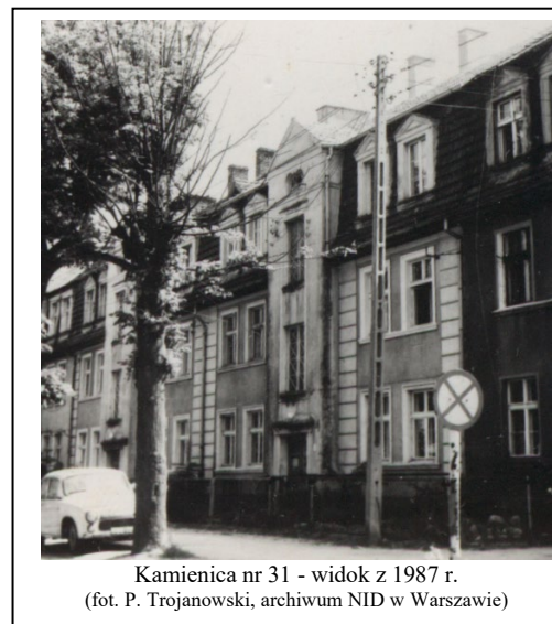
Kamienica nr 31 - widok z 1987 r.