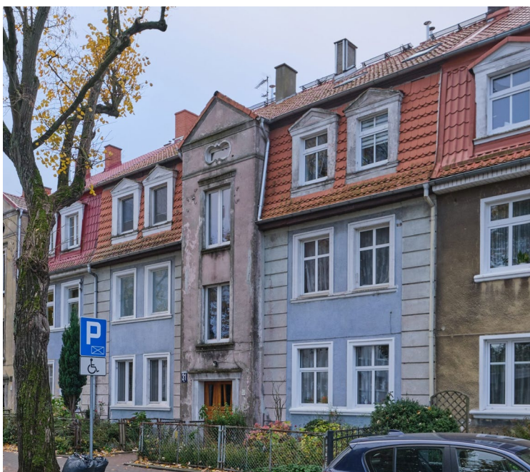
Widok elewacji frontowej od północy

7. Fotografia z opisem wskazującym orientację albo mapa z zaznaczonym stanowiskiem archeologicznym