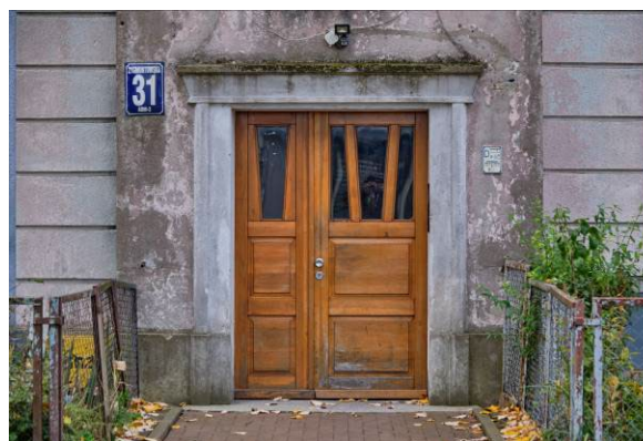
Wejście frontowe do kamienicy