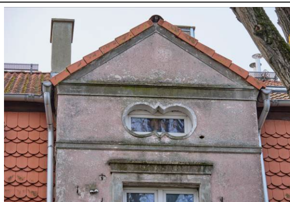
Widok szczytu ryzalitu