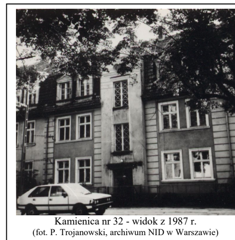
Kamienica nr 32 - widok z 1987 r.