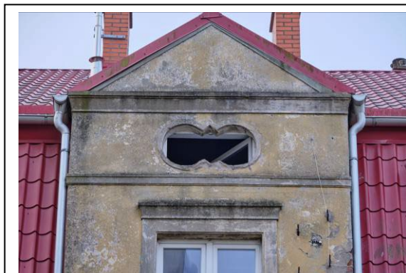
Zwieńczenie ryzalitu frontowego