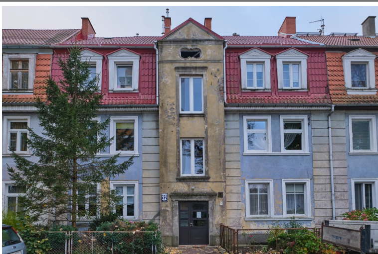
Widok ogólny bryły od pñ.-wschodu

7. Fotografia z opisem wskazującym orientację albo mapa z zaznaczonym stanowiskiem archeologicznym