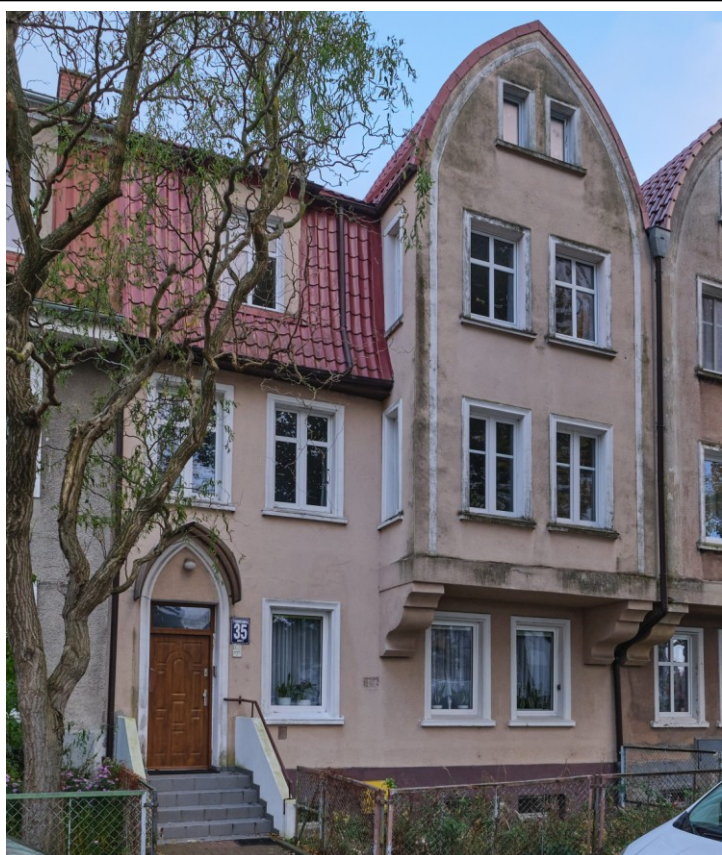
Widok fasady od płn.-wsch.

7. Fotografia z opisem wskazującym orientację albo mapa z zaznaczonym stanowiskiem archeologicznym