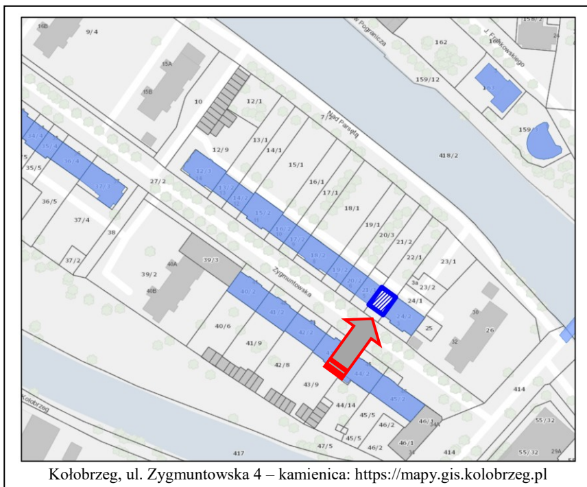
Kołobrzeg, ul. Zygmuntowska 4 – kamienica: https://mapy.gis.kolobrzeg.pl