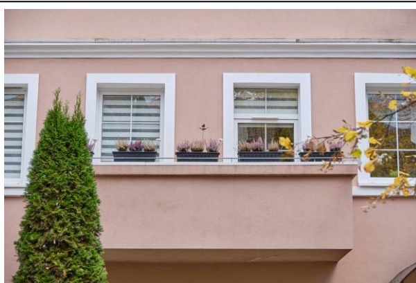
Widok balkonu i wtórnej stolarki okien