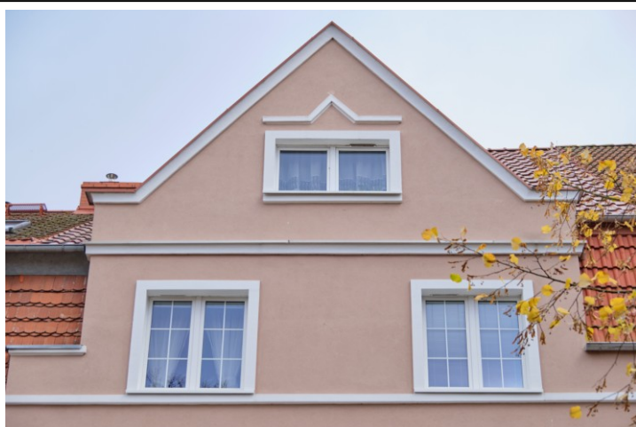
Widok poddasza od zachodu