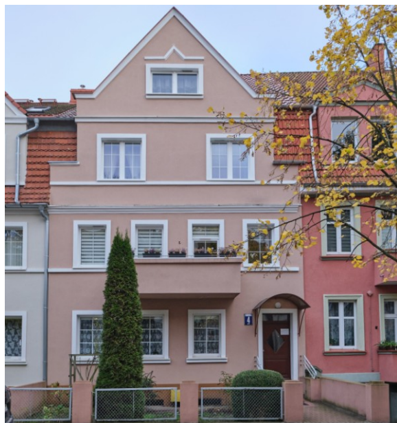
Widok na elewację frontową od zachodu

7. Fotografia z opisem wskazującym orientację albo mapa z zaznaczonym stanowiskiem archeologicznym