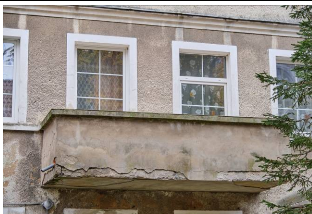
Widok na drugą kondygnację kamienicy, z balkonem