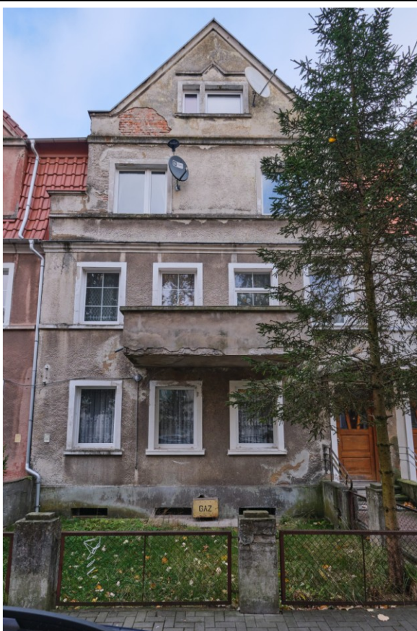
Widok elewacji frontowej

7. Fotografia z opisem wskazującym orientację albo mapa z zaznaczonym stanowiskiem archeologicznym