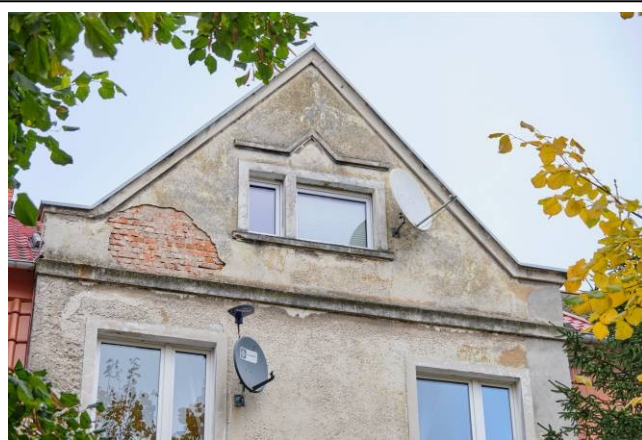
Widok na szczyt frontowej elewacji kamienicy