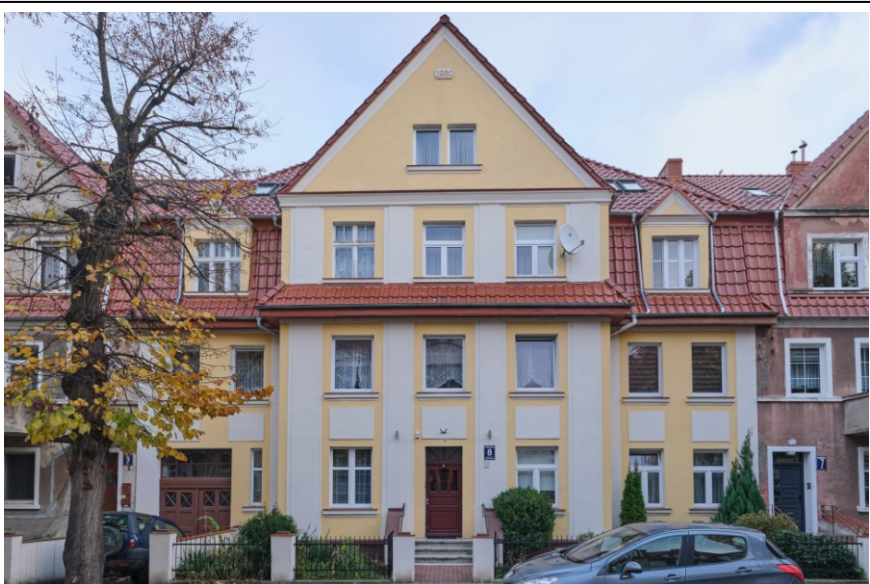
Widok na elewację frontową

7. Fotografia z opisem wskazującym orientację albo mapa z zaznaczonym stanowiskiem archeologicznym