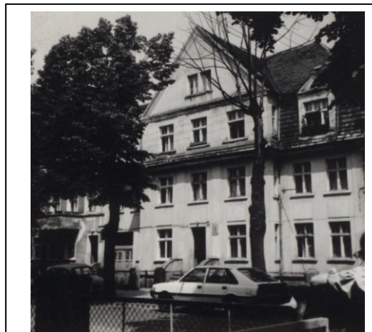
Kamienica nr 8 - widok z 1987 r.