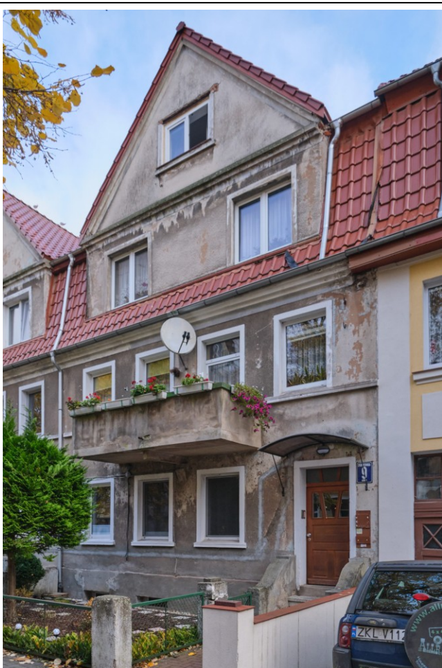
Widok elewacji frontowej od płd.

7. Fotografia z opisem wskazującym orientację albo mapa z zaznaczonym stanowiskiem archeologicznym