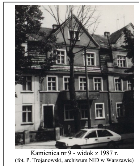
Kamienica nr 9 - widok z 1987 r.