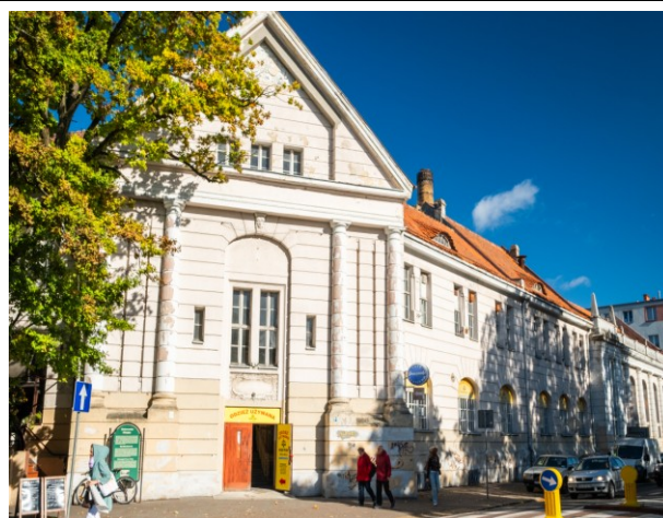
Część narożna z ryzalitem i wejściem – widok od pld.-zach.