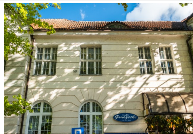
Elewację frontową (zach.) skrzydła bocznego – widok od zach.