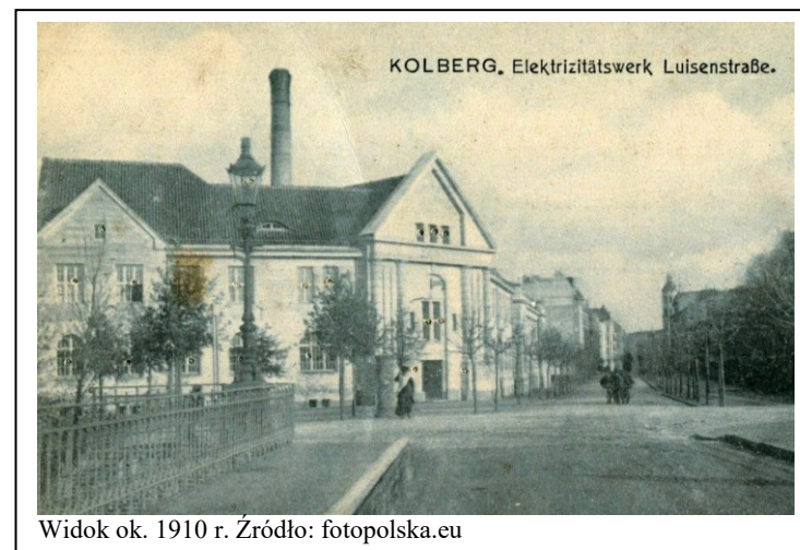
Widok ok. 1910 r.

- wszelkie prace budowlano-konserwatorskie winny być uzgadniane z MKZ w Kołobrzegu. Obowiązuje ochrona prawna w zakresie pełnego zachowania: /kształtowania bryły (w tym gabaryty wysokościowe, proporcje wysokości ścian i dachu, forma dachu)/ konstrukcji i materiału budowlanego/ ukształtowania elewacji, w tym rozmieszczenia i formy otworów okiennych, drzwiowych oraz detalu architektonicznego/ stolarki okiennej i drzwiowej, przy wymianie wymagane jest odtworzenie poprzedniej formy i zastosowanie pierwotnego rodzaju materiału/ zasadniczego układu oraz wystroju wnętrza/ bezpośredniego otoczenia obiektu zabytkowego