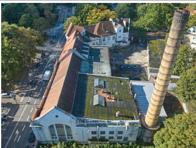
Widok ogólny bryły z lotu ptaka - od strony wschodniej

7. Fotografia z opisem wskazującym orientację albo mapa z zaznaczonym stanowiskiem archeologicznym