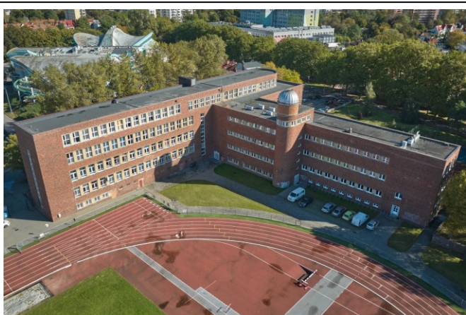
Widok ogólny bryły z lotu ptaka od strony płd.-zachodniej

7. Fotografia z opisem wskazującym orientację albo mapa z zaznaczonym stanowiskiem archeologicznym