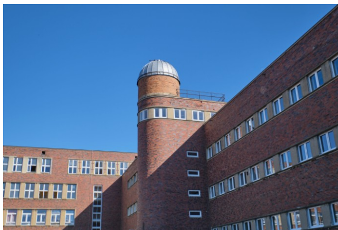
Widok na elewacje dziedzińcowe skrzydła zach. i płd.