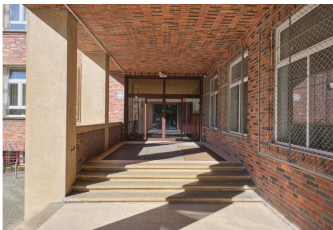
Wejście główne od strony wschodniej skrzydła wschodniego