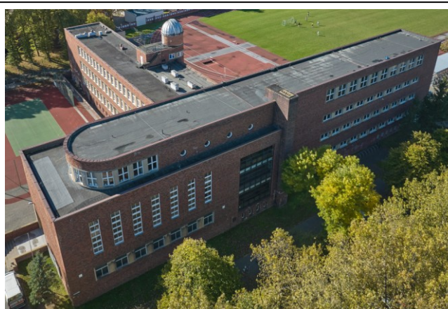
Widok ogólny bryły z lotu ptaka od strony pół.-wschodniej