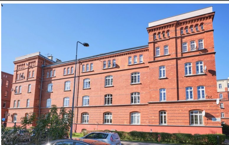
Elewacja frontowa - wschodnia

7. Fotografia z opisem wskazującym orientację albo mapa z zaznaczonym stanowiskiem archeologicznym