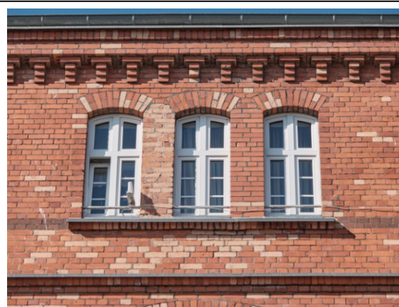
Okna i gzymsy koronujące