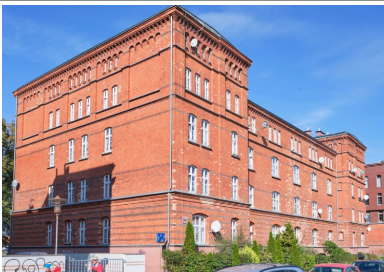
Widok ogólny od płd.-wschodu

7. Fotografia z opisem wskazującym orientację albo mapa z zaznaczonym stanowiskiem archeologicznym