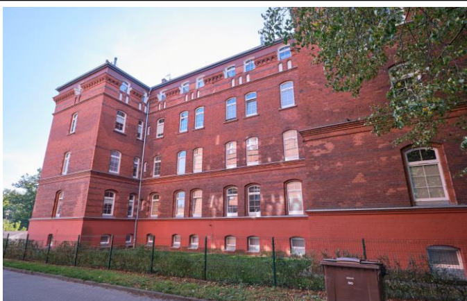
Widok od północy