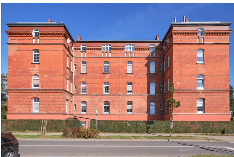
Widok ogólny od południa

7. Fotografia z opisem wskazującym orientację albo mapa z zaznaczonym stanowiskiem archeologicznym