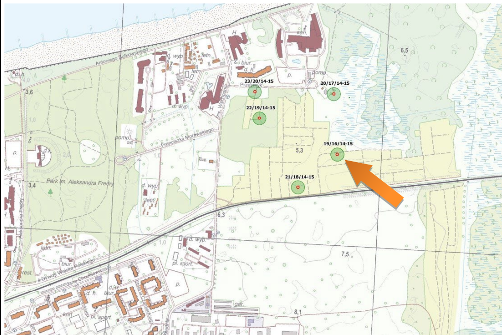
Obszar stanowiska przedstawiony w szerszym kontekście

Janocha H., Lachowicz F., karta ewidencji stanowiska archeologicznego, arkusz AZP 14-15/16/19, 1984.