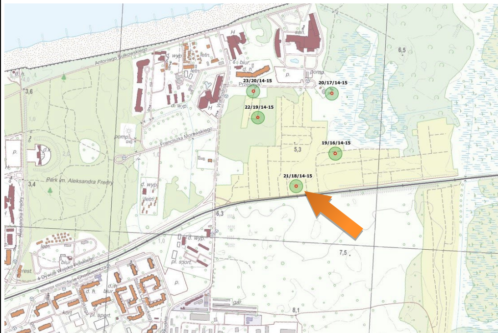
Obszar stanowiska przedstawiony w szerszym kontekście

Janocha H., Lachowicz F., karta ewidencji stanowiska archeologicznego, arkusz AZP 14-15/18/21, 1984.