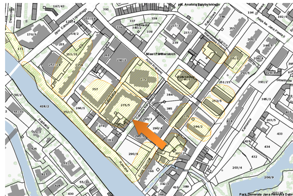
Obszar stanowiska na mapie – https://mapy.gis.kolobrzeg.pl

Ochrona polega na ograniczeniu ingerencji w grunt. Prowadzenie wszelkich prac związanych z ingerencją w grunt, w tym robót budowlanych wymaga uzyskania pozwolenia od wojewódzkiego konserwatora zabytków. W przypadku prowadzenia robót ziemnych, związanych z inwestycjami, należy przeprowadzić archeologiczne badania terenowe w niezbędnym zakresie, który zgodnie z art. 31 ustawy z dnia 23.07.2003 r. określi na wniosek inwestora wojewódzki konserwator zabytków.