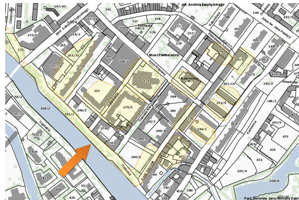
Obszar stanowiska na mapie – https://mapy.gis.kolobrzeg.pl

Ochrona polega na ograniczeniu ingerencji w grunt. Prowadzenie wszelkich prac związanych z ingerencją w grunt, w tym robót budowlanych wymaga uzyskania pozwolenia od wojewódzkiego konserwatora zabytków. W przypadku prowadzenia robót ziemnych, związanych z inwestycjami, należy przeprowadzić archeologiczne badania terenowe w niezbędnym zakresie, który zgodnie z art. 31 ustawy z dnia 23.07.2003 r. określi na wniosek inwestora wojewódzki konserwator zabytków.