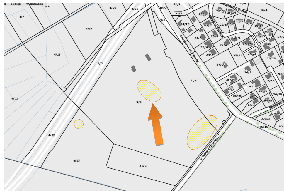
Obszar stanowiska na mapie – https://mapy.gis.kolobrzeg.pl

Ochrona polega na ograniczeniu ingerencji w grunt. Prowadzenie wszelkich prac związanych z ingerencją w grunt, w tym robót budowlanych wymaga uzyskania pozwolenia od wojewódzkiego konserwatora zabytków. W przypadku prowadzenia robót ziemnych, związanych z inwestycjami, należy przeprowadzić archeologiczne badania terenowe w niezbędnym zakresie, który zgodnie z art. 31 ustawy z dnia 23.07.2003 r. określi na wniosek inwestora wojewódzki konserwator zabytków.