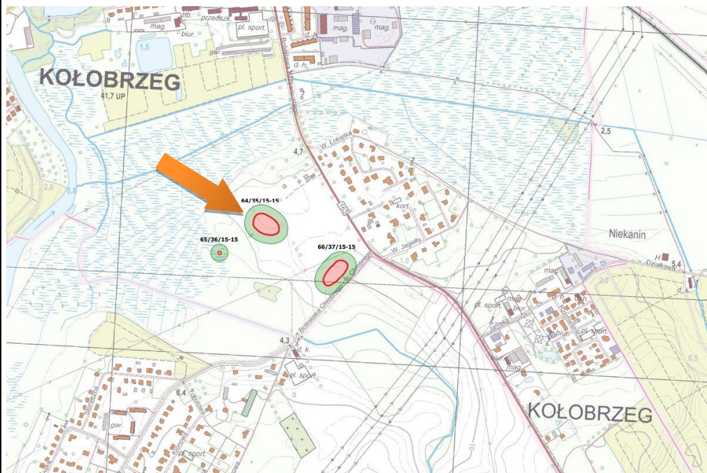
Obszar stanowiska przedstawiony w szerszym kontekście

Lachowicz F., karta ewidencji stanowiska archeologicznego, arkusz AZP 15-15/35/64, 1987.