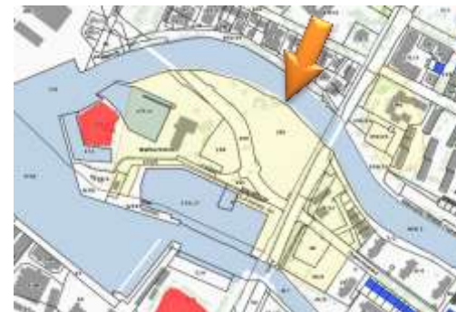
Obszar stanowiska na mapie – https://mapy.gis.kolobrzeg.pl