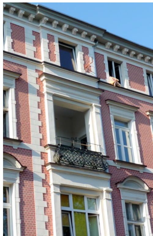
Loggia w elewacji południowej