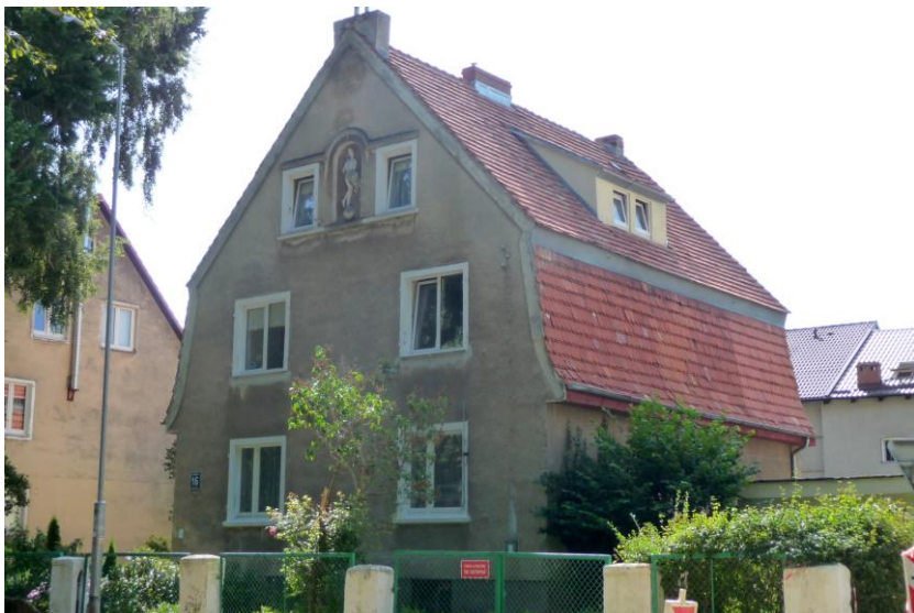
Widok budynku od północnego-zachodu

8. Fotografia z opisem wskazującym orientację albo mapa z zaznaczonym stanowiskiem archeologicznym