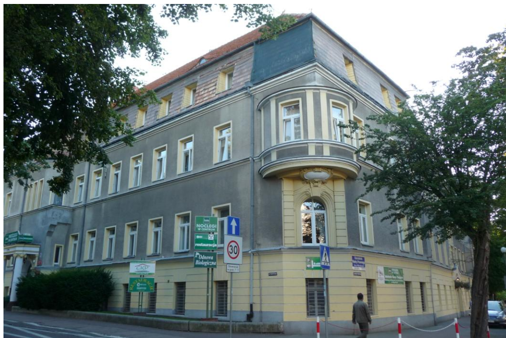
Widok budynku od wschodu

ul. Katedralna 12/ Walki Młodych 9 78-100 Kołobrzeg dz. nr 195/3 obr. 12