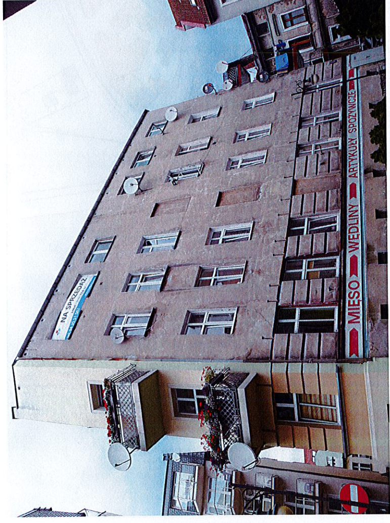
Widok budynku od południowo-wschodu

8. Fotografia z opisem wskazującym orientację albo mapa z zaznaczonym stanowiskiem archeologicznym