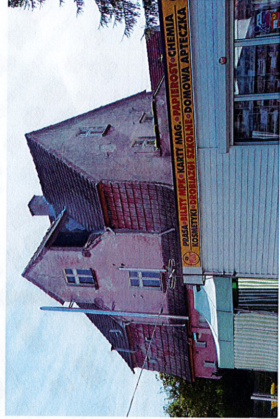
Widok budynku od zachodu