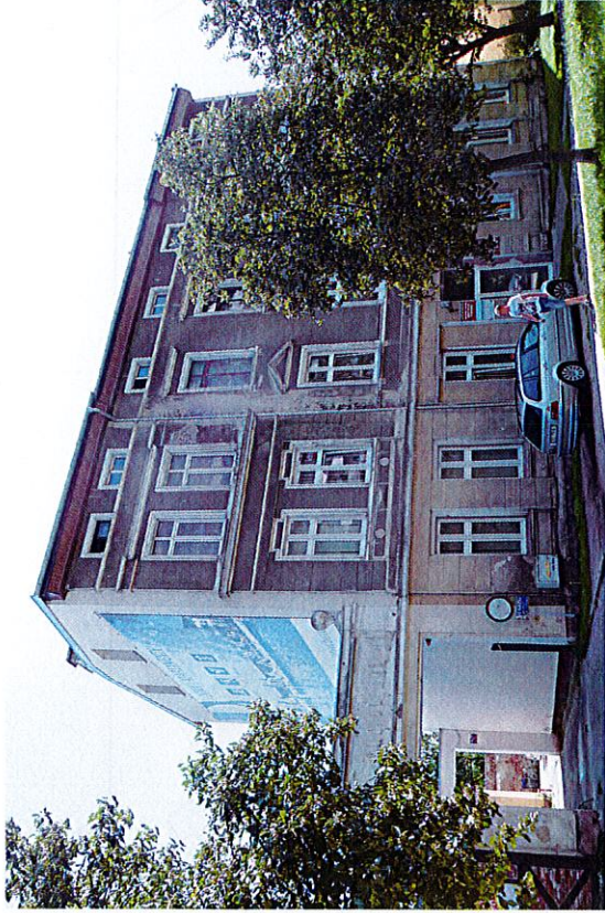
Widok budynku od północnego-zachodu

8. Fotografia z opisem wskazującym orientację albo mapa z zaznaczonym stanowiskiem archeologicznym