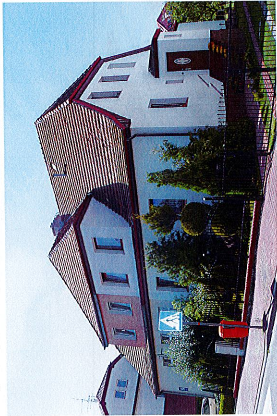
Widok budynku od północnego-wschodu

8. Fotografia z opisem wskazującym orientację albo mapa z zaznaczonym stanowiskiem archeologicznym