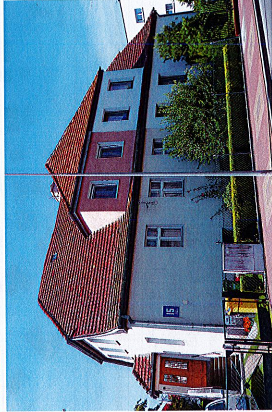
Widok budynku od wschodu