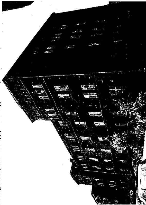
Widok budynku od wschodu

8. Fotografia z opisem wskazującym orientację albo mapa z zaznaczonym stanowiskiem archeologicznym