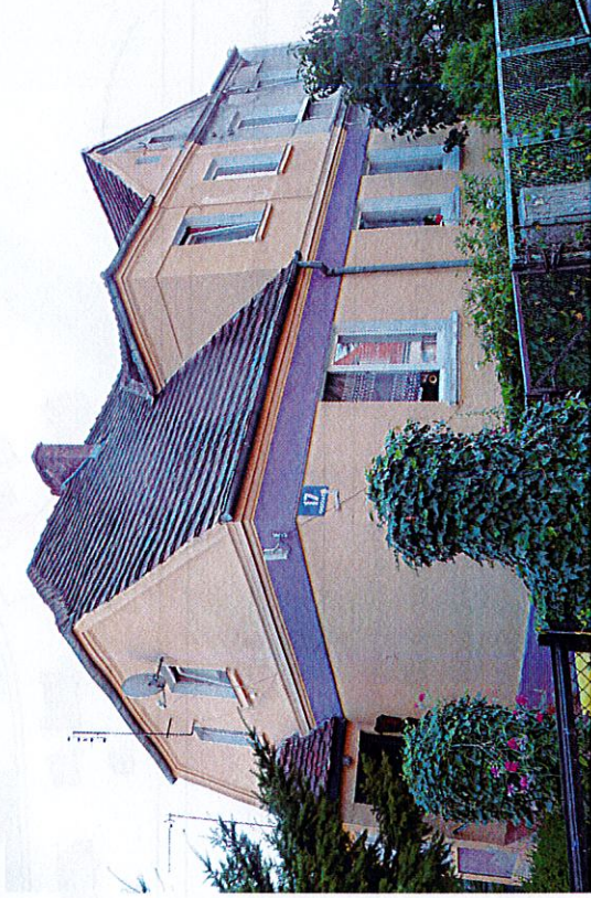
Widok budynku od wschodu