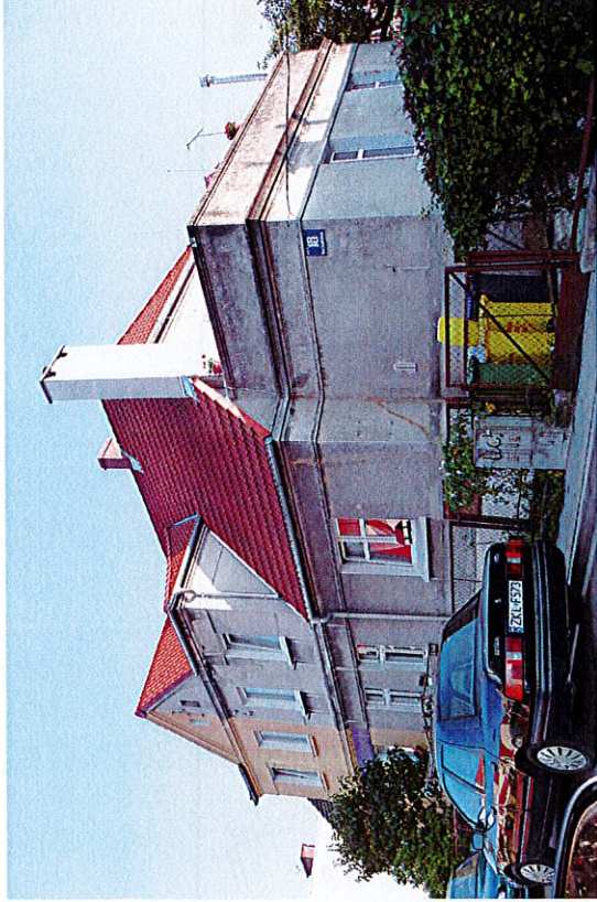
Widok budynku od północy

8. Fotografia z opisem wskazującym orientację albo mapa z zaznaczonym stanowiskiem archeologicznym