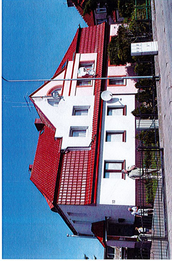
Widok budynku od południa

8. Fotografia z opisem wskazującym orientację albo mapa z zaznaczonym stanowiskiem archeologicznym