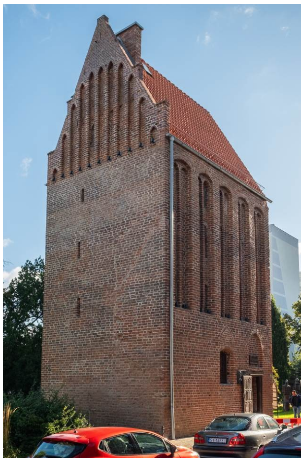
Widok ogólny bryły od południowego zachodu