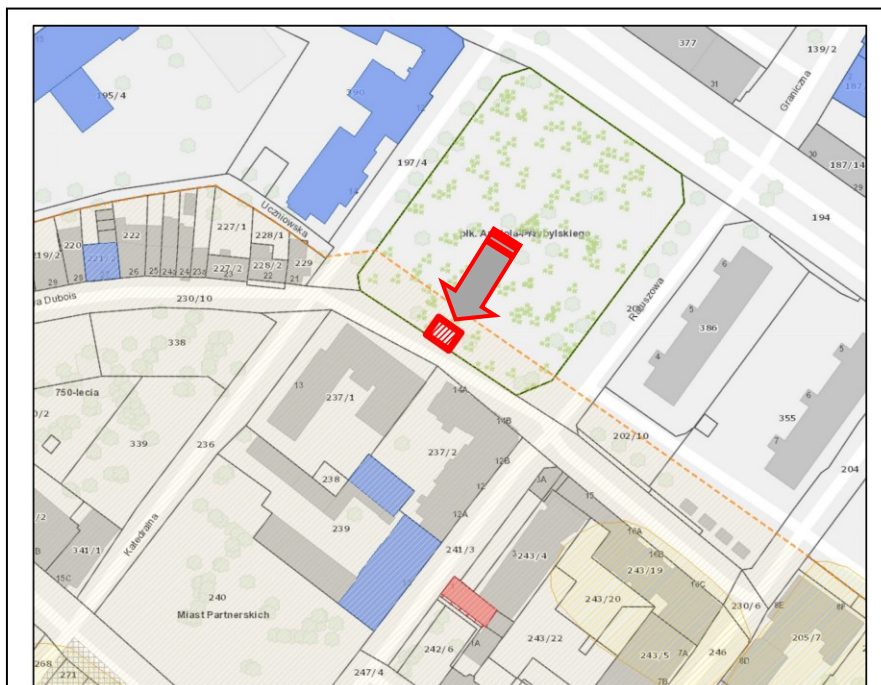
Kołobrzeg, ul. Dubois 20 - Baszta Prochowa: https://mapy.gis.kolobrzeg.pl/

Gotycka Baszta Lontowa jest jednym z najstarszych i najcenniejszych zabytków Kołobrzegu, wybitnie waloryzuje śródmiejską przestrzeń. Posadowiona obecnie w obrębie nowoczesnej zabudowy mieszkalnej, dokumentuje istnienie średniowiecznych (niezachowanych) obwarowań miejskich.