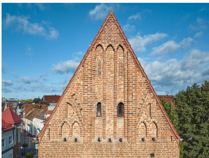
Szczyt elewacji bocznej wschodniej