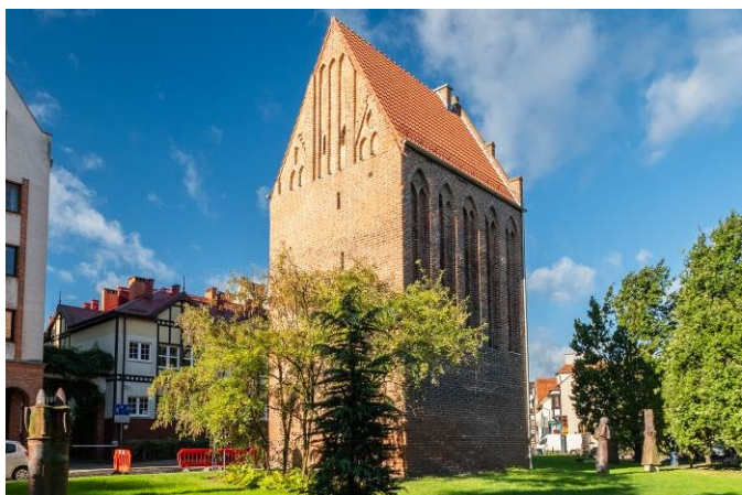
Widok ogólny bryły od północnego wschodu

7. Fotografia z opisem wskazującym orientację albo mapa z zaznaczonym stanowiskiem archeologicznym