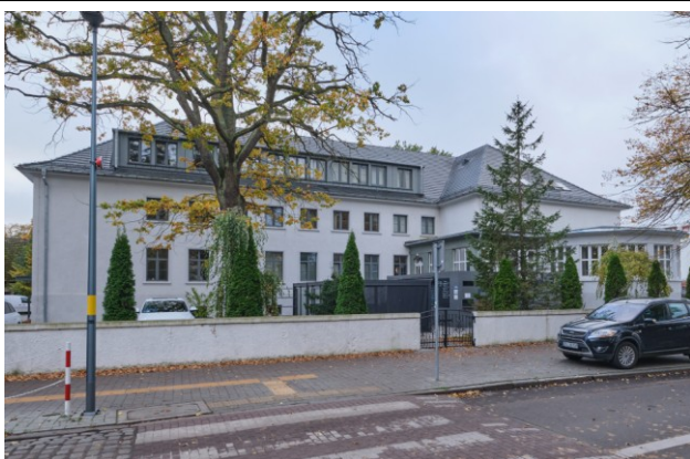
Widok ogólny bryły od strony północnej

7. Fotografia z opisem wskazującym orientację albo mapa z zaznaczonym stanowiskiem archeologicznym