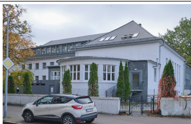
Widok ogólny bryły od strony północno-zachodniej