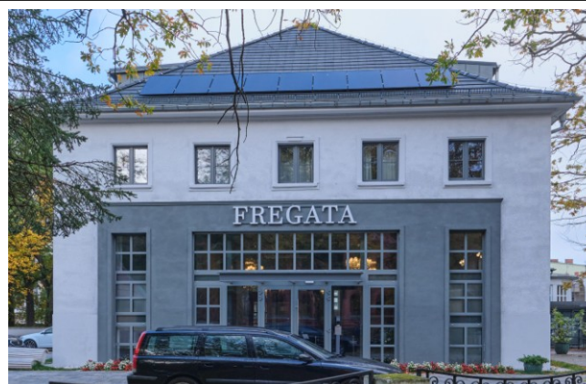
Widok na elewację frontową wschodnią (zmodernizowaną)