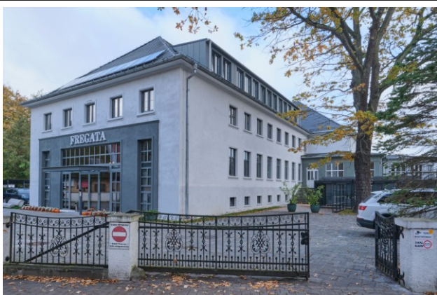
Widok ogólny bryły od strony północno-wschodniej