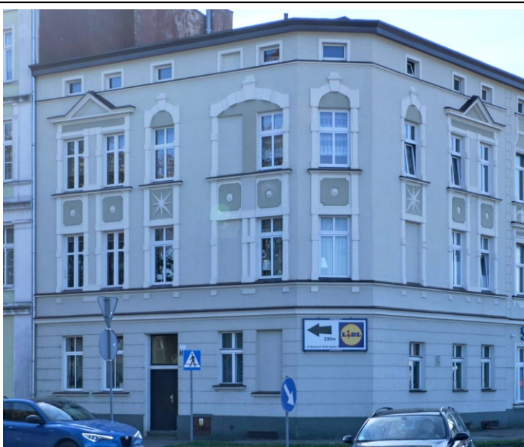
Widok ogólny od północy

7. Fotografia z opisem wskazującym orientację albo mapa z zaznaczonym stanowiskiem archeologicznym