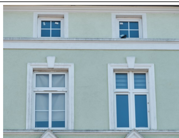
Okna 3-piętra i poddasza