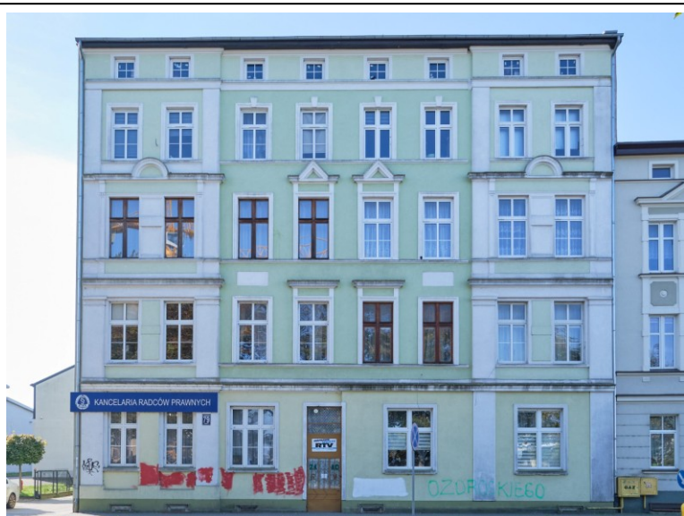
Elewacja frontowa - północna

7. Fotografia z opisem wskazującym orientację albo mapa z zaznaczonym stanowiskiem archeologicznym