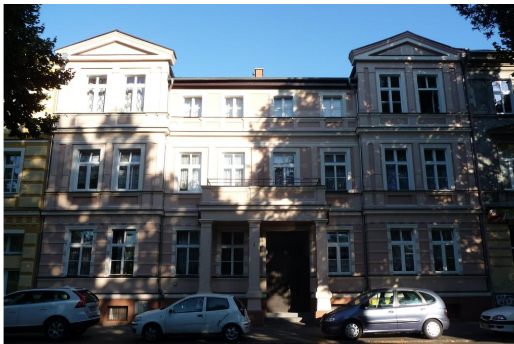
Widok budynku od północnego-zachodu

ul. Pomorska 4 78-100 Kołobrzeg dz. nr 11 obr. 12