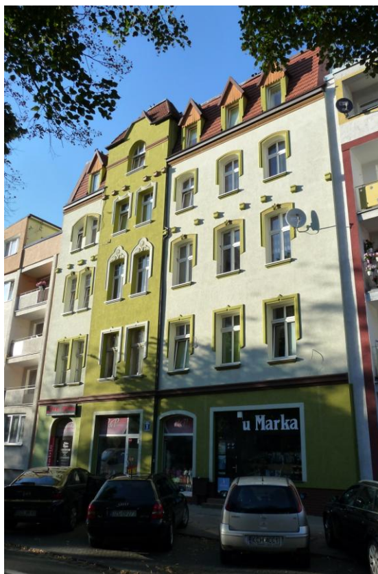
Widok budynku od południowego-zachodu