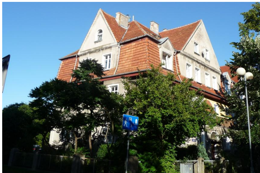
Widok budynku od zachodu

8. Fotografia z opisem wskazującym orientację albo mapa z zaznaczonym stanowiskiem archeologicznym