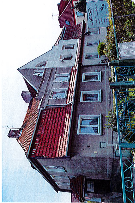
Widok budynku od południowego-zachodu

8. Fotografia z opisem wskazującym orientację albo mapa z zaznaczonym stanowiskiem archeologicznym